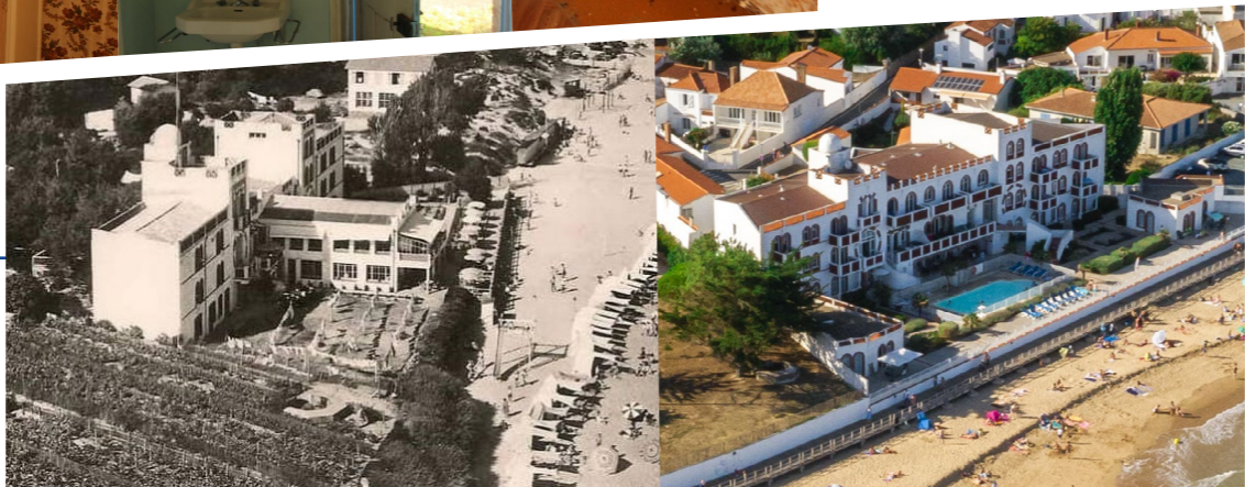
L'hôtel de l'Océan avant / après