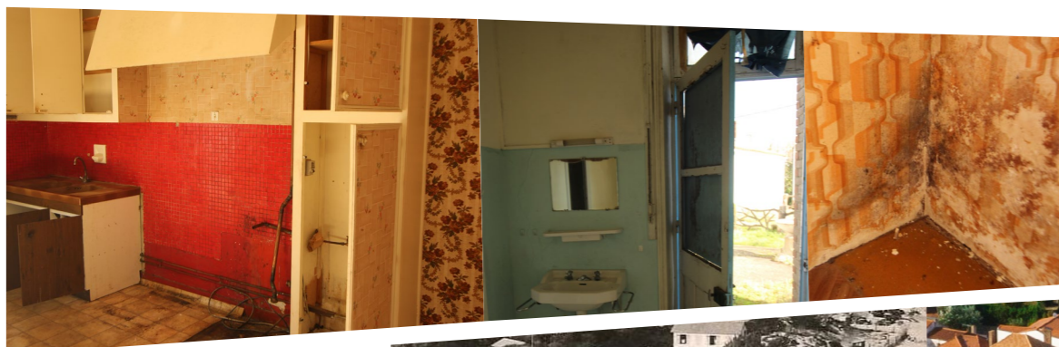
La Maison Mourat