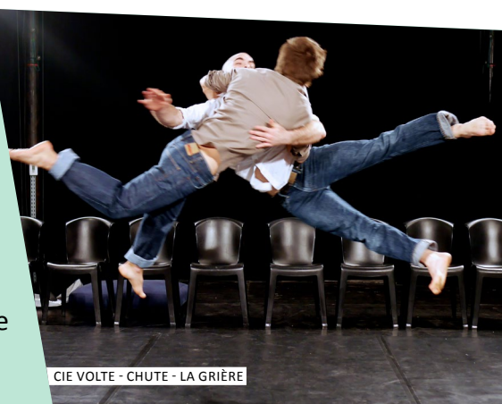
CIE VOLTE - CHUTE - LA GRIÈRE

Une permanence sera assurée pour renseigner les résidents n'ayant pas pu être présents à la réunion publique le jeudi 25 avril : 10h/12h et de 14h/16h.